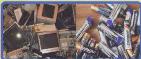
Equipements électriques et électroniques*

* Incluent les réfrigérateurs, machines à laver, téléviseurs, ordinateurs, téléphones portables, radios, imprimantes, photocopieuses, aspirateurs, ventilateurs, fours électriques, piles usagées, tubes fluorescents et lampes fluorescentes compactes, entre autres.