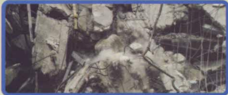
Débris de construction